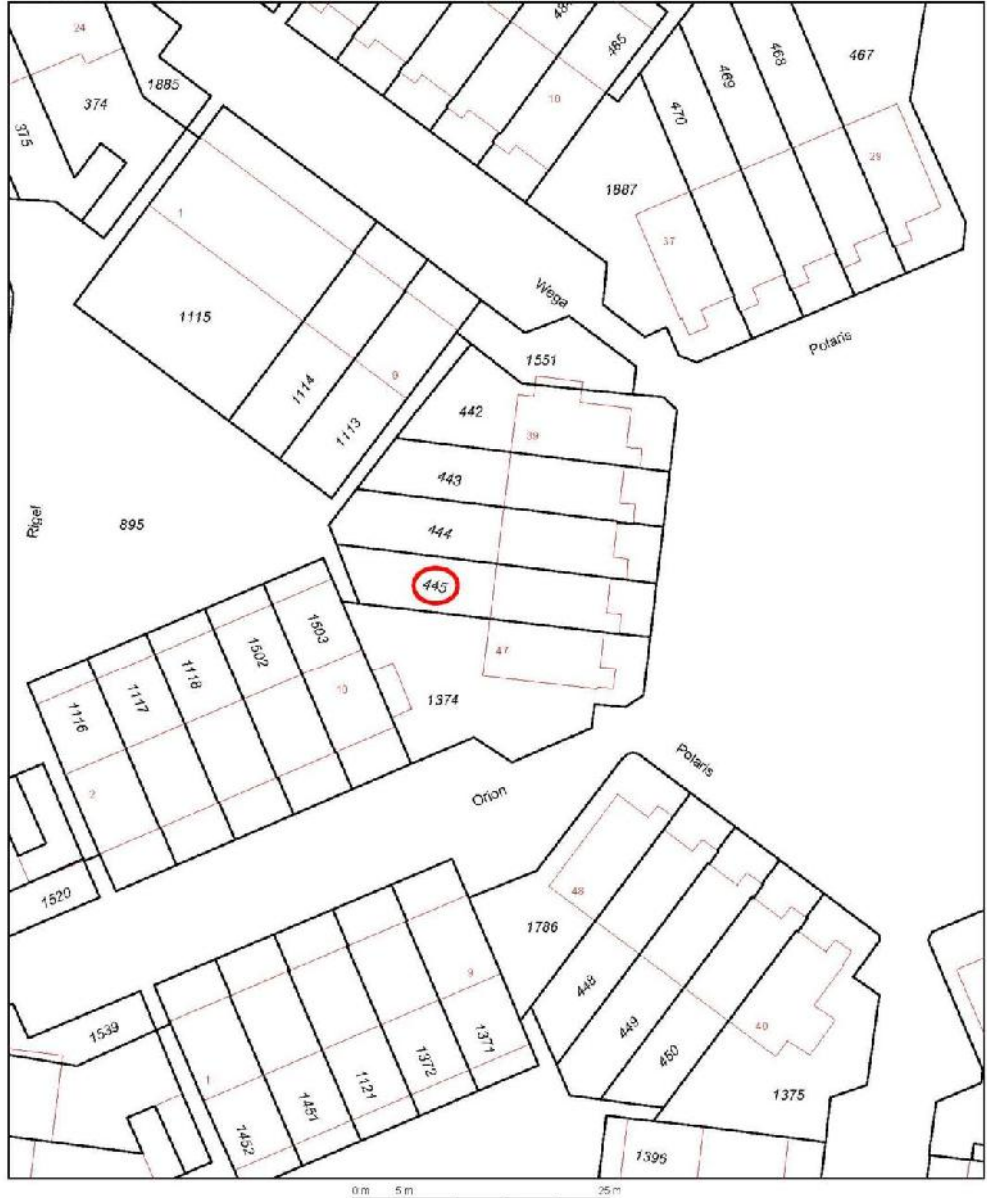
Uittreksel Kadastrale Kaart